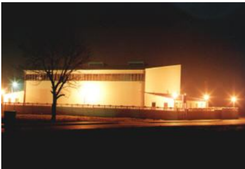
Oczyszczalnia ścieków Dąbie

Największe możliwości rozwojowe w gminie ma rolnictwo, ale dostrzegana jest również szansa i potrzeba rozwoju usług, przede wszystkim w otoczeniu rolnictwa i również przetwórstwa rolno – spożywczego, turystyki i przemysłu. Należy podkreślić walory Gminy, jakimi są: korzystne położenie w centrum kraju przy autostradzie A-2, atrakcyjne tereny inwestycyjne, sprzyjający klimat dla działalności gospodarczej, rozwinięte rolnictwo, korzystne ukształtowanie terenu dla