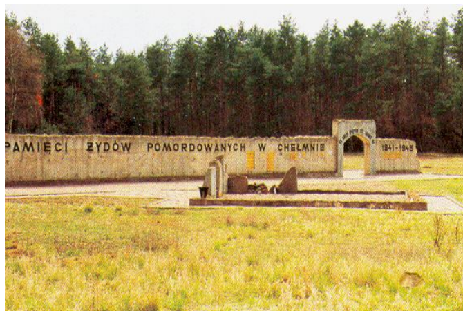
Były obóz zagłady w Chełmnie