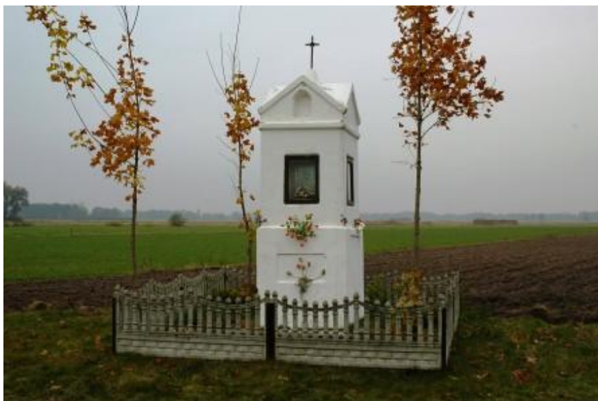
Zdjęcie 2. Przydrożna kapliczka 1

Na terenie wsi postawione są przydrożne krzyże oraz kapliczki (Zdjęcie 2, Zdjęcie 3).