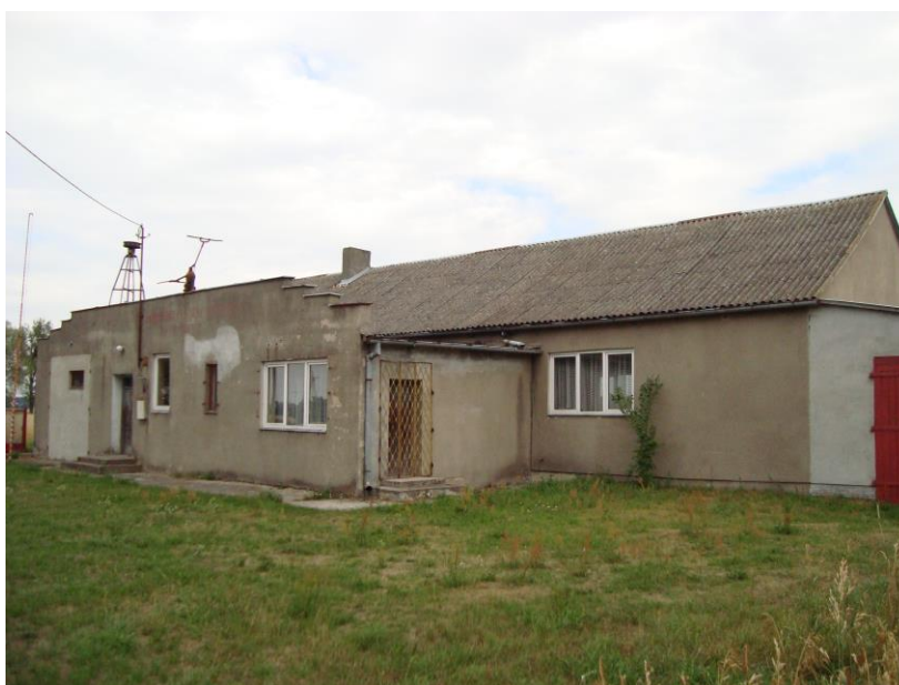
Zdjęcie 4. Świetlica wiejska

Wieś jest w całości zwodociągowana i zelektryfikowana. Jest możliwość korzystania z Internetu. Telefonizacja – na terenie wsi działają operatorzy telefonii stacjonarnej oraz komórkowej. Zasięg jest wystarczający. Wśród obiektów najważniejszym społecznie obiektem we wsi Cichmiana jest świetlica wiejska i remiza strażacka zarazem (Zdjęcie 4). Jest to miejsce spotkań, integracji i zabawy mieszkańców wsi. Wymaga ono jednak doposażenia oraz modernizacji. To pilna potrzeba mieszkańców miejscowości