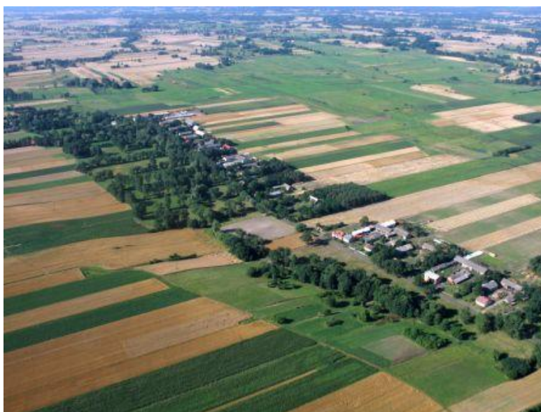
Zdjęcie 1. Cichmiana z lotu ptaka

Wieś posiada duże walory krajobrazu (ogrody przydomowe). Posiada również walory klimatu (duże nasłonecznienie oraz wiatr), średnie walory szaty roślinnej (rośliny, kwiaty, drzewa, runo leśne). W miejscowości jest dużo zwierząt hodowlanych i domowych (trzoda chlewna, bydło mleczne, koty, psy). Cichmiana położona jest na obszarze Niziny Środkowopolskiej. Gleby są tu średniej klasy i słabe (Zdjęcie 1).