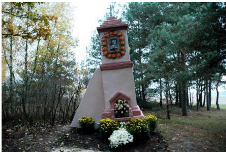
Zdjęcie 3. Przydrożna kapliczka 2