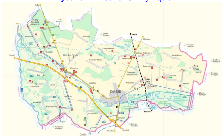
Rysunek 2. Podział Gminy Dąbie