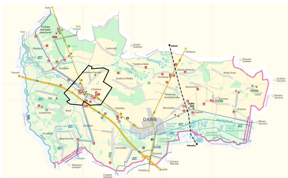
Rysunek 2. Położenie wsi Chełmno w Gminie Dąbie

W podziale regionalnym autorstwa Jerzego Kondrackiego z 1976 r, grunty znajdują się na obszarze Nizin Środkowopolskich, we wschodniej części makroregionu Niziny Południowowielkopolskiej i w południowej części mezoregionu Wysoczyzny Kłódawskiej.