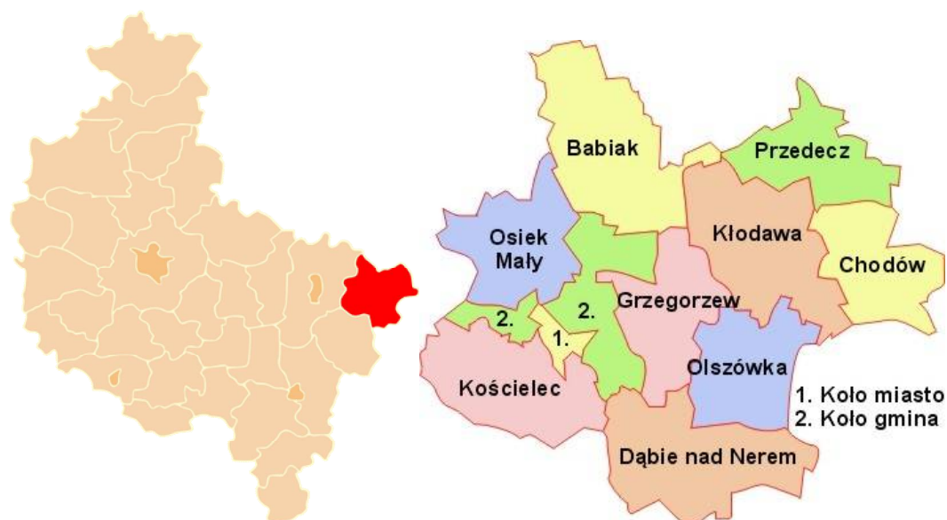
Rysunek 1. Gmina Dąbie w Wielkopolsce i w powiecie kolskim