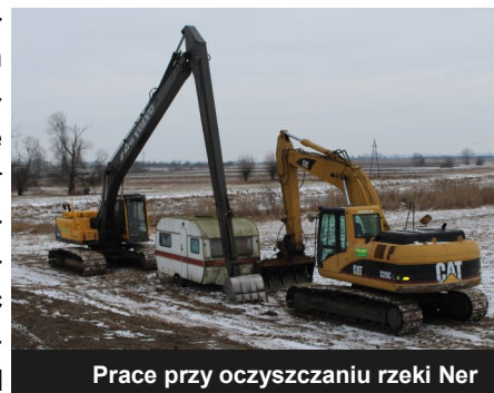
Prace przy oczyszczaniu rzeki Ner

W celu zwiększenia bezpieczeństwa powodziowego na rzece Ner usunięto zator przy moście w celu udrożnienia koryta rzeki. Całość prac objęła odcinek ok. 1 km. od kładki do rzeki Pisi. Roboty wykonano przed wiosennymi spływami co pozwoliło na bezpieczne przeprowadzenie wody przez naszą miejscowość. Prace sfinansowane zostały z środków zewnętrznych w ramach bieżącego utrzymania wód. Wykonawcą była firma POLKOP z Gaju na zlecenie Wielkopolskiego Zarządu Melioracji.