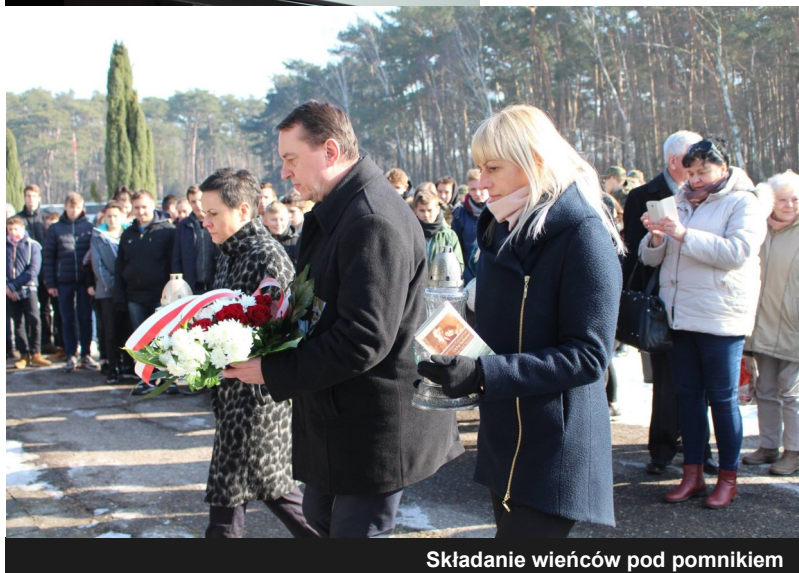
Składanie wieńców pod pomnikiem