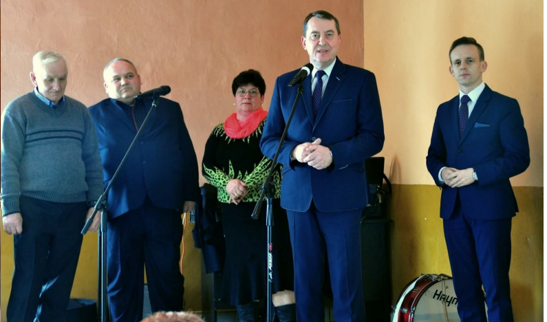
Uroczystości z okazji święta Kobiet