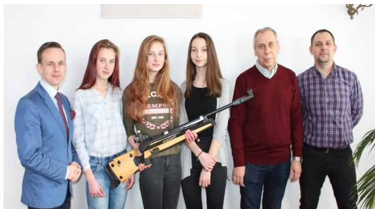
Nowy nabytek Koła Strzeleckiego