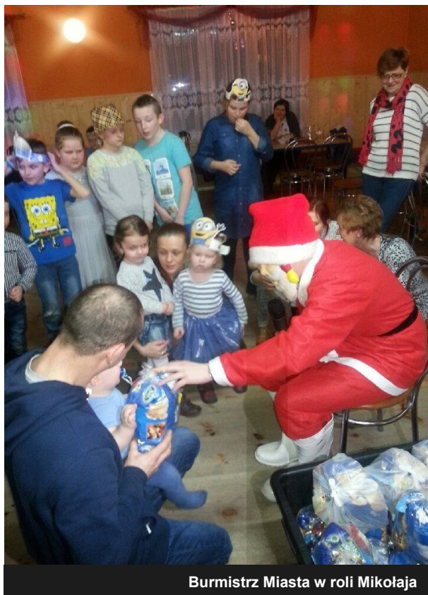
Burmistrz Miasta w roli Mikołaja