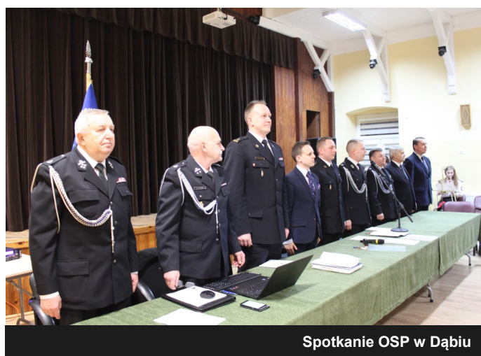
Spotkanie OSP w Dąbiu