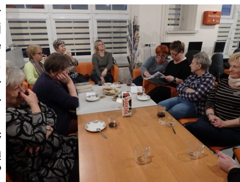
Omawianie wybranych pozycji książkowych