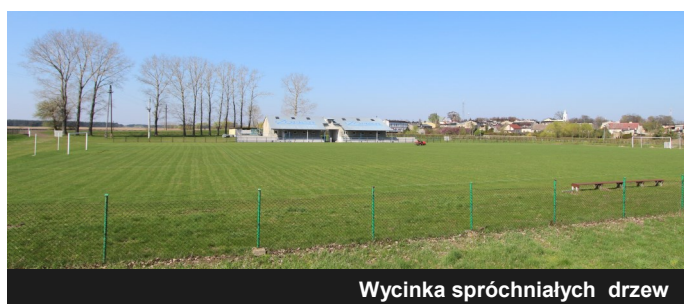
Wycinka spróchniałych drzew

Prace przy renowacji stadionu miejskiego nie ustały mimo srożej zimy. Niedawno na obiekcie wycięto drzewostan, który z uwagi na liczne pęknięcia i spróchniałe konary zagrażał bezpieczeństwu użytkowników. Wszystkie zabiegi mają na celu przygotować płytę boiska wraz przyległym terenem do nowego sezonu piłkarskiego