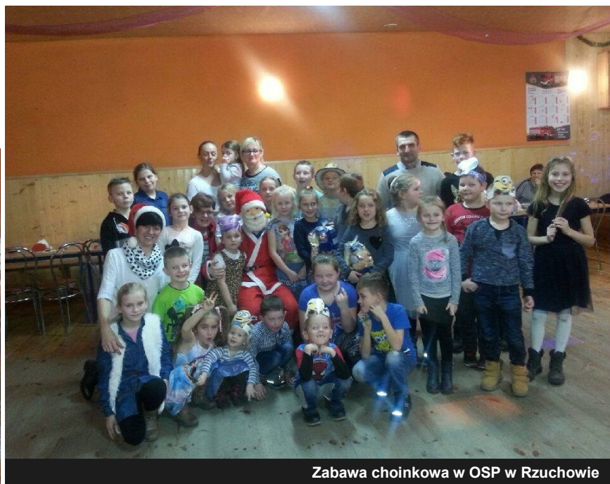
Zabawa choinkowa w OSP w Rzuchowie

przy organizacji imprezy, włączyło się również Koło Gospodyń Wiejskich oraz Sołtys wsi. „Choinka” organizowana jest z myślą o najmłodszych i cieszy się dużym zainteresowaniem i aprobatą ze strony mieszkańców. Dzieci udekorowane w karnawałowe akcenty bawiły się podczas zabawy tanecznej. Ponadto organizatorzy zadbali również o ciepły posiłek i słodkości dla wszystkich uczestników.