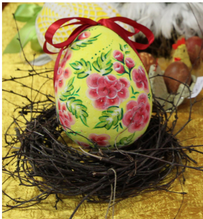
Praca przygotowana przez "Stowarzyszenie Kobiet Chata za Wsią w Karszewie" na X Przegląd Tradycji Wielkanocnych w Kulturze Ludowej