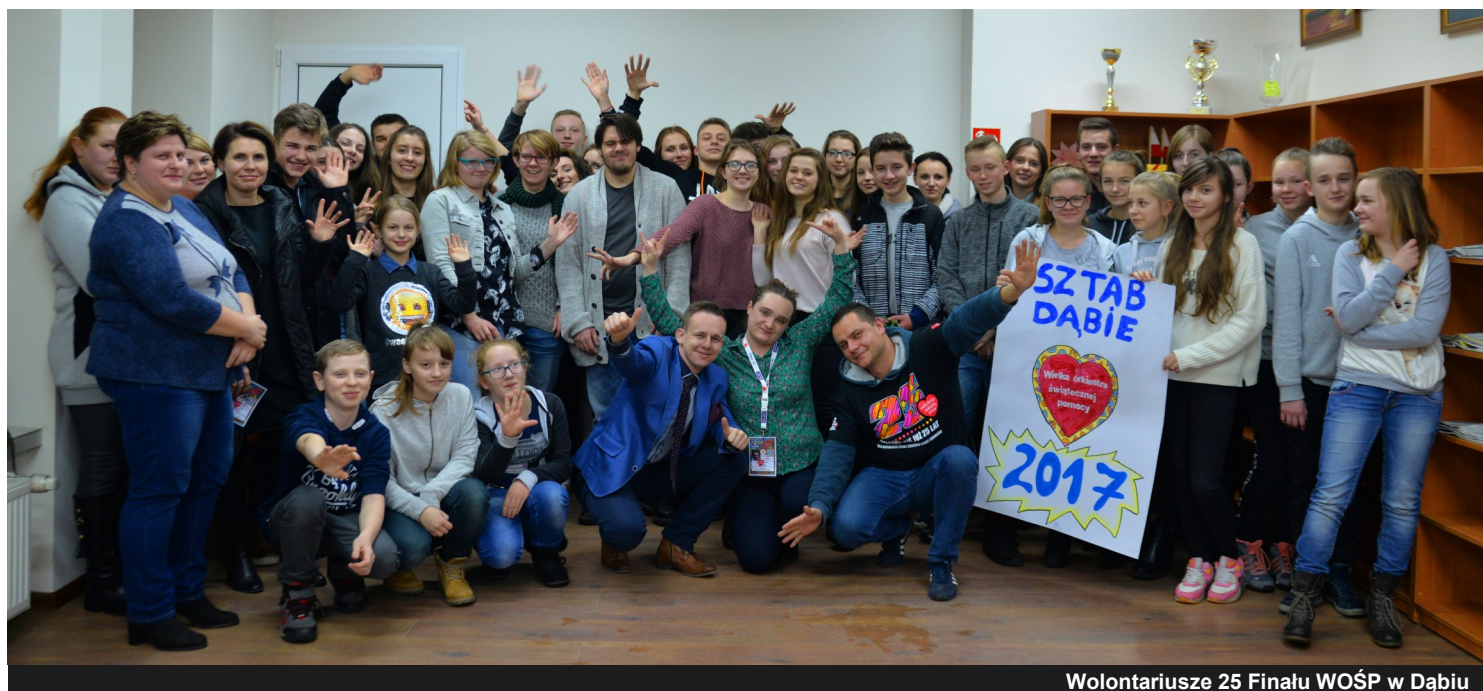
Wolontariusze 25 Finału WOŚP w Dąbiu

Wszyscy uczestnicy mogli skorzystać z ciepłego poczęstunku w formie gorących zup, kielbasek z grilla, kawy, herbaty oraz ciast. Tradycyjnie po godz. 20:00 odbył się pokaz fajerwerków - „światelko do nieba”.