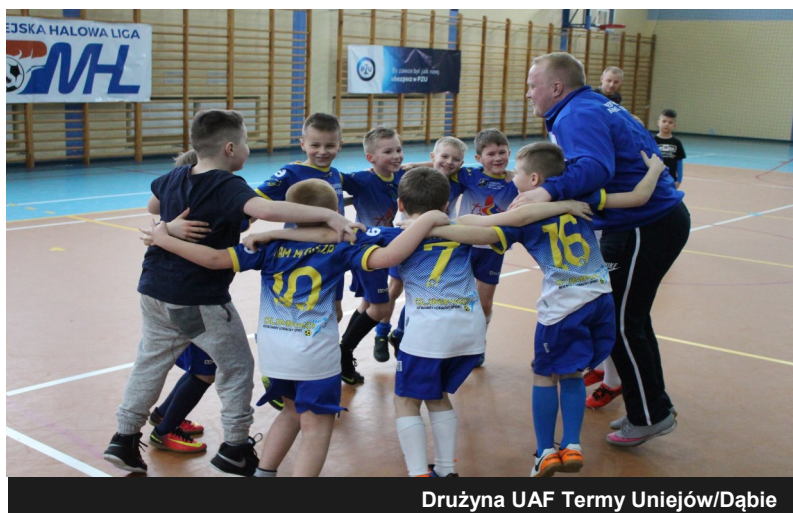
Drużyna UAF Termy Uniejów/Dąbie