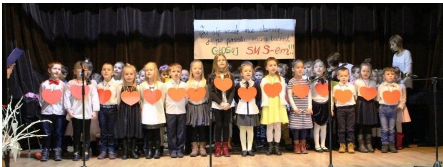
Dzień Babci i Dziadka