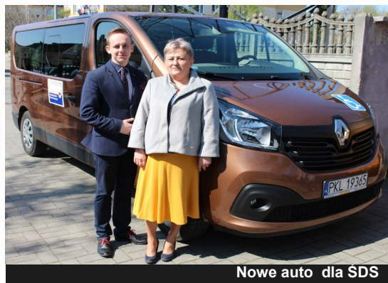
Nowe auto dla ŚDS

W grudniu ubiegłego roku Środowiskowy Dom Samopomocy w Dąbiu otrzymał nowe auto, specjalnie przystosowane do przewozu osób niepełnosprawnych. Przystąpienie do „Programu wyrównywania różnic między regionami III” umożliwiło pozyskać prawie 80.000,00 zł z Państwowego Funduszu Rehabilitacji Osób Niepełnosprawnych na zakup specjalistycznego auta, które zastąpiło wysłużonego już Volkswagena. Całość projektu opiewa na kwotę ponad 130.000,00 zł z czego wkład własny gminy to ponad 55.000,00 zł .