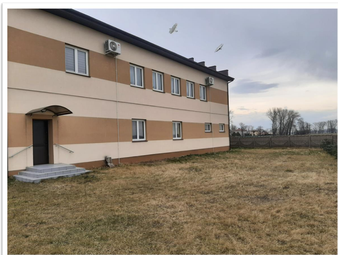
Teren za świetlicą