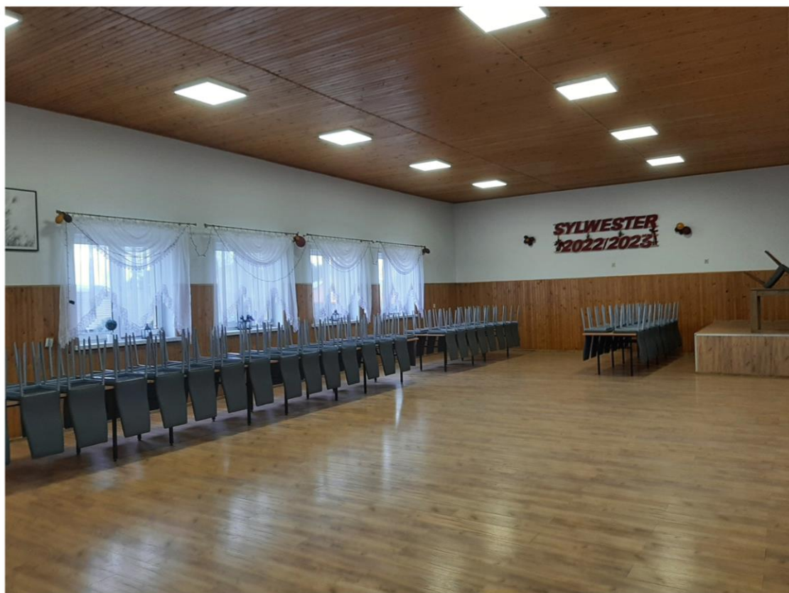
Sala w świetlicy wiejskiej