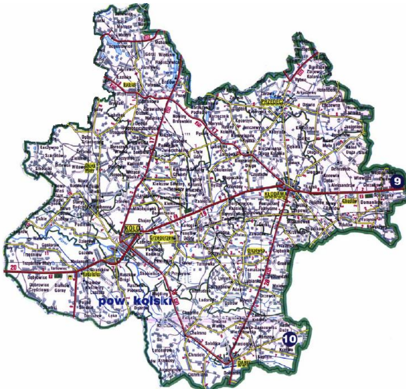
Rysunek 2 Gminy należące do Związku Międzygminnego „Kolski Region Komunalny”.

Do Związku Międzygminnego „Kolski Region Komunalny” należą wszystkie gminy powiatu kolskiego. Region położony jest we wschodniej części województwa wielkopolskiego. Graniczy od zachodu z powiatem konińskim i tureckim województwa wielkopolskiego a od wschodu z gminami województwa kujawsko-pomorskiego i łódzkiego.