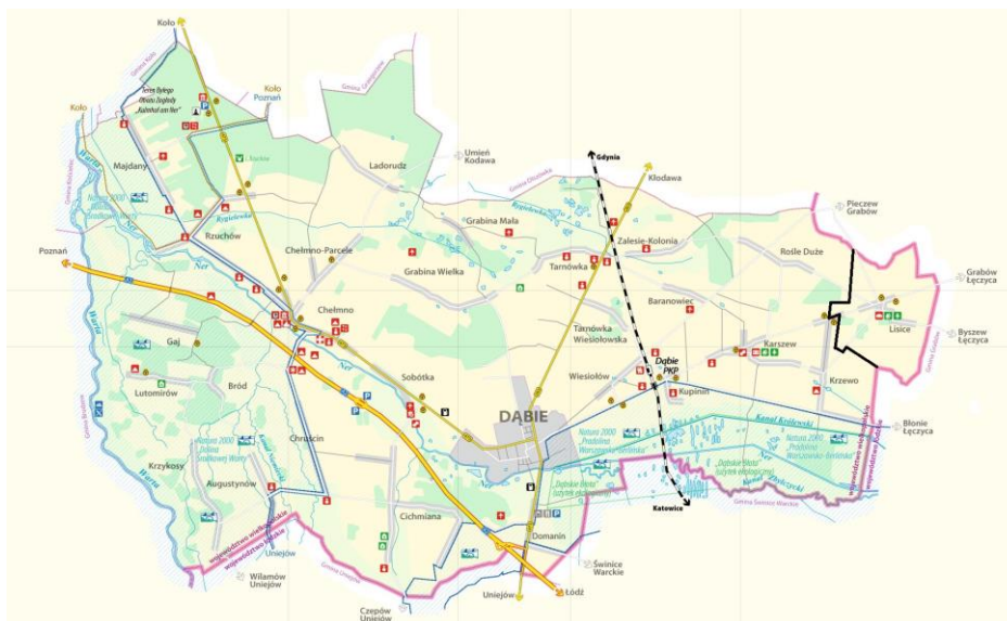
Rysunek 2. Położenie wsi Lisice w Gminie Dąbie

Lisice to wieś położona w województwie wielkopolskim, w powiecie kolskim, w gminie Dąbie. W latach 1975-1998 miejscowość administracyjnie należała do województwa konińskiego. Wieś znajduje się niedaleko autostrady A2. Miejscowość położona jest na granicy z województwem łódzkim. Od północy graniczy z wsią Rośle, od wschodu z miejscowością Goszczędza (gm. Grabów, woj. łódzkie), od zachodu z wsią Krzewo, a od południa z miejscowością Leszno (rysunek 2). W podziale regionalnym autorstwa Jerzego Kondrackiego z 1976 r, grunty znajdują się na obszarze Nizin Środkowopolskich, we wschodniej części makroregionu Niziny Południowowielkopolskiej i w południowej części mezoregionu Wysoczyzny Kłodawskiej.