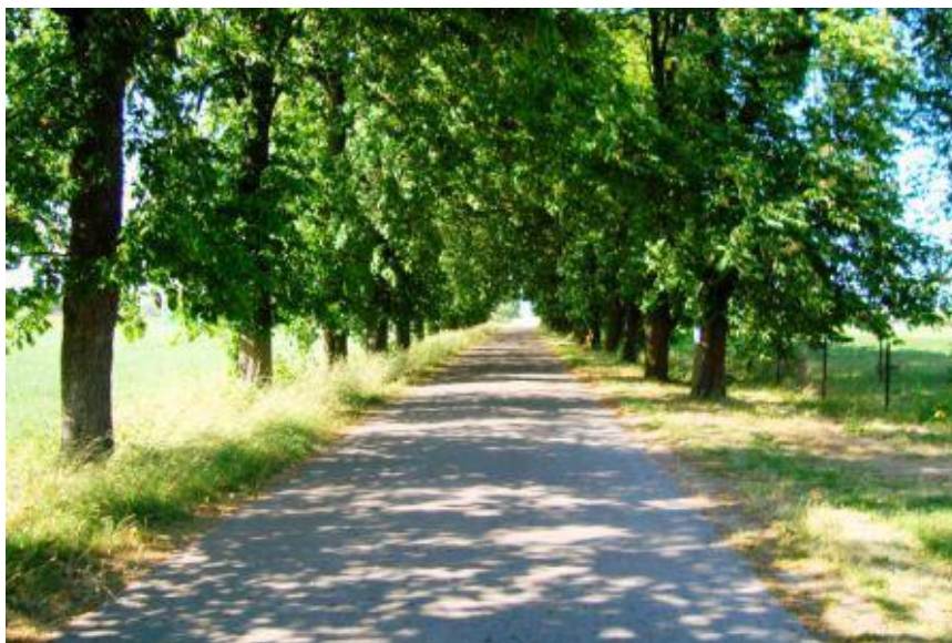
Zdjęcie 1. Aleja kasztanów

Na terenie Lisic znajduje się park dworski, objęte są w nim ochroną drzewa, znajduje się tam pomnik przyrody – stare dęby. Główna droga wjazdowa jest obsadzona aleją kasztanów (Zdjęcie 1). Gleby są tu średniej klasy i słabe.