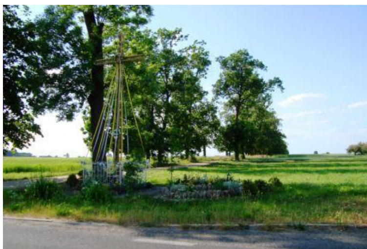
Zdjęcie 2. Przydrożny krzyż 1

Na terenie wsi postawione są przydrożne krzyże (Zdjęcie 2, Zdjęcie 3) oraz kapliczki (Zdjęcie 4, Zdjęcie 5).