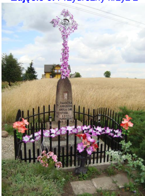
Zdjęcie 3. Przydrożny krzyż 2