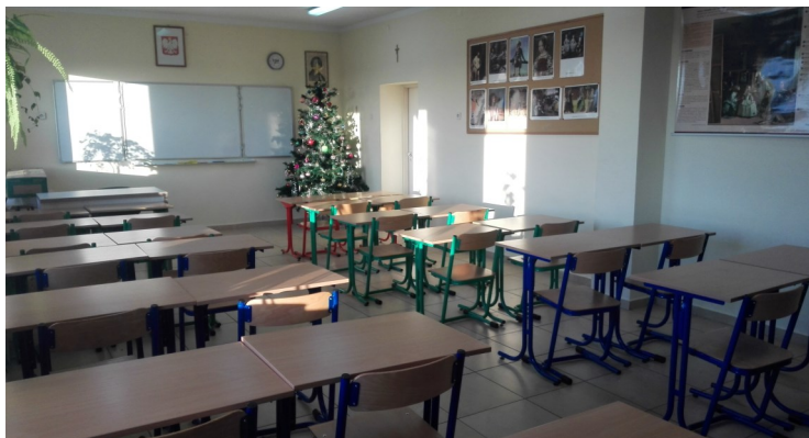
Sala dydaktyczna w Dąbiu

W Zespole Szkół w Dąbiu wyremontowano dach na sali gimnastycznej na łączną kwotę 39 985,30 zł , a także przeprowadzono inne remonty - sal, łazienek, szatni oraz wymianę mebli w salach. Łączna wartość wykonanych prac to 29 699,10 zł , a koszt zakupu mebli wyniósł 12 151,96 zł . W Karszewie zaś wymalowano sale lekcyjne i grzejniki.