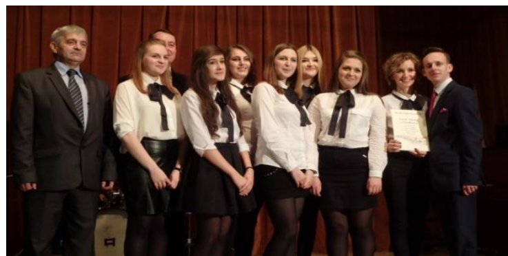
Przegląd dorobku artystycznego

22 listopada po raz 27 odbył się Przegląd Dorobku Artystycznego Miasta i Gminy Dąbie. Uczestnicy prezentowali różne formy artystyczne, a werdykt nie był łatwy. Imprezę uświetnił występ Scholi Effatha z Chwałborzyc.