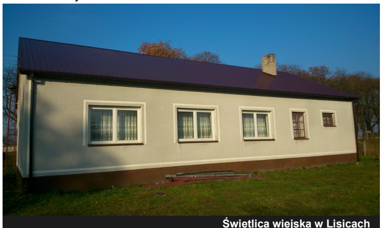
Świetlica wiejska w Lisicach

Dzięki determinacji władz i mieszkańców w październiku 2015 roku w ramach środków finansowych pochodzących z funduszu sołectkiego w kwocie 12 236,68 zł brutto zrealizowano inwestycję polegającą na wymianie pokrycia dachowego na budynku Świetlicy Wiejskiej oraz części bojowej OSP w miejscowości Lisice.