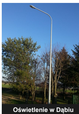
Oświetlenie w Dąbie

W 2015 roku w miejscowościach Zalesie, Cichmiana oraz Dąbie poczyniono inwestycje w oświetlenie uliczne,