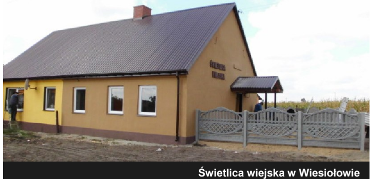
Świetlica wiejska w Wiesiołowie

W 2015 roku przekształcono w świetlicę wiejską obiekt znajdujący się we miejscowości Wiesiołów. Sala została wyremontowana. Wymieniono m.in. pokrycie dachowe wraz z wykonaniem obróbek blacharskich, wykonano ogrodzenie wokół budynku, zamontowano nowe okna i otynkowano budynek z zewnątrz. Całkowity koszt prac to 38 000,00 zł .