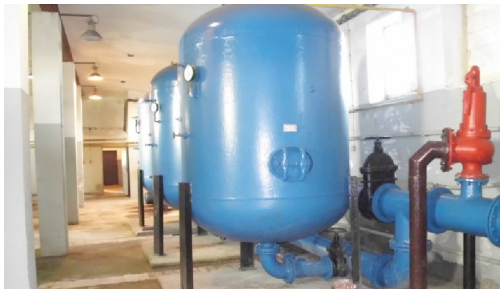
Stacja uzdatniania wody w Chełmnie

W Gminie Dąbie przeprowadzono modernizację stacji uzdatniania wody w miejscowości Chełmno, która polegała na wymianie istniejących zbiorników filtracyjnych na nowe. Wartość całej inwestycji do 125 000,00 zł .