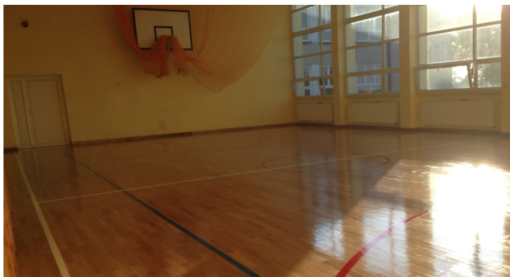
Sala gimnastyczna w Chełmnie

W 2015 roku udało się przeprowadzić kilka znaczących remontów w szkołach w naszej gminie. Największym z nich był remont sali gimnastycznej, szatni i korytarza w Szkole Podstawowej w Chełmnie, którego łączny koszt wyniósł 90 832,37 zł . Oprócz tego w Chełmnie wykonano prace remontowe na łączną kwotę 10 557,60 zł .