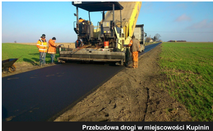
Przebudowa drogi w miejscowości Kupinin

Prócz tego w budżecie udało się również wygospodarować dodatkowe środki pochodzące z oszczędności w innych działach. Dzięki nim mogliśmy przebudować drogi gminne w miejscowości Augustynów, Sobótka oraz Kupinin, których łączna wartość wyniosła 257 590,54 zł .