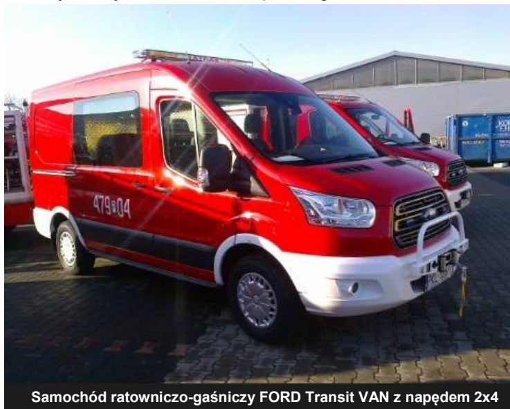
Samochód ratowniczo-gaśniczy FORD Transit VAN z napędem 2x4

W dniu 5 grudnia 2015 roku Prezes Ochotniczej Straży Pożarnej w Dąbiu w siedzibie Wykonawcy (FRANK CARS Sp. z o. o) w Częstochowie odebrał lekki samochód ratowniczo-gaśniczy FORD Transit VAN z napędem 4x2. Samochód został zakupiony z dofinansowaniem ze środków Samorządu Województwa Wielkopolskiego.