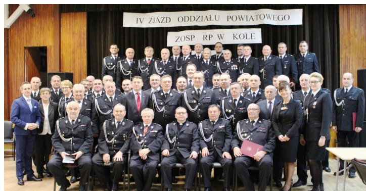
Strażacy z powiatu kolskiego