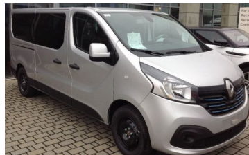
Nowy samochód dla ŚDS

Jeszcze w tym roku Środowiskowy Dom Samopomocy w Dąbiu otrzyma nowe auto, specjalnie przystosowane do przewozu osób niepełnosprawnych. Przystąpienie do „Programu wyrównywania różnic między regionami III” umożliwiło pozyskać prawie 80.000,00 zł z Państwowego Funduszu Rehabilitacji Osób Niepełnosprawnych na zakup specjalistycznego auta, które zastąpi wysłużonego już Volkswagena. Całość projektu opiewa na kwotę ponad 130.000,00 zł z czego wkład własny gminy to ponad 55.000,00 zł.