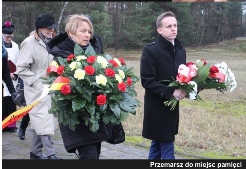
Przemarsz do miejsc pamięci

Dnia 8 grudnia 2016 w Lesie Rzuchowskim odbyły się uroczystości upamiętniające 75 rocznicę pierwszego transportu ofiar do niemieckiego, nazistowskiego obozu zagłady Kulmhof w Chełmnie nad Nerem.