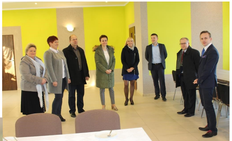
Odbiór świetlicy wiejskiej w Lisicach

W remont świetlicy zaangażowała się niemal cała wieś. Dzięki tak okazałej kwocie wykonano gruntowne prace w środku, na elewacji zewnętrznej jak i na placu przy świetli-