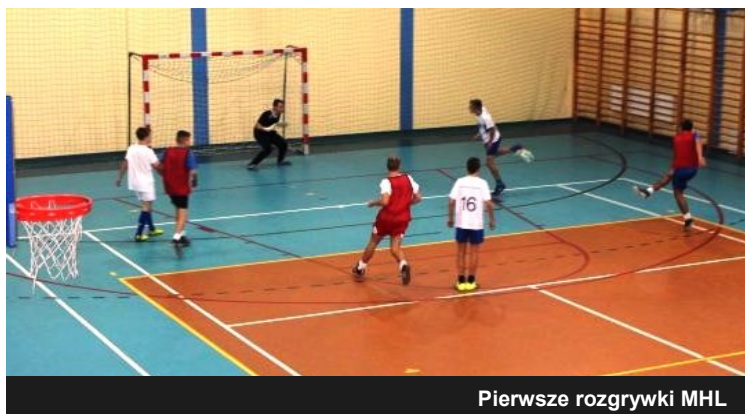
Pierwsze rozgrywki MHL

Rozgrywki zostały objęte patronatem Konińskiego Okręgowego Związku Piłki Nożnej w Koninie. Głównym sponsorem imprezy został Powszechny Zakład Ubezpieczeń S.A.