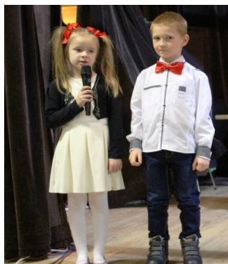
Dzieci na występach