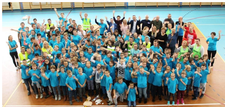
Uczestnicy bicia rekordu Guinnessa