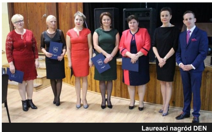
Laureaci nagród DEN