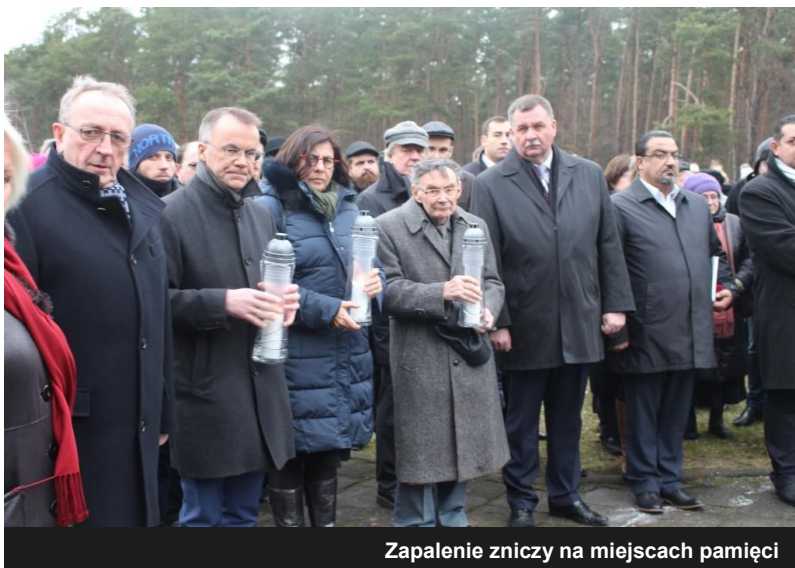
Zapalenie zniczy na miejscach pamięci

Początek obchodów miał miejsce w Łodzi na historycznej stacji Radegast, z której podczas II wojny światowej naziści odprawiali pociągi z więźniami z Litzmannstadt (pierwszy transport miał miejsce w dniu 8 grudnia 1941 roku z getta w Kole). Następnie uczestnicy obchodów udali się na teren Lasu Rzuchowskiego, gdzie znajdują się masowe mogiły ofiar z Kulmhof. Wystuchano oficjalnych przemówień, odmówiono modlitwy i złożono hołd poległym ofiarom. Podczas wystąpień zebranych gości miał miejsce telemost z Instytutem Pamięci Męczenników i Bohaterów Holokaustu Yad Vashem w Izraelu.