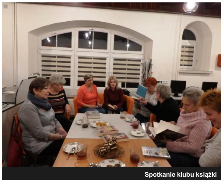
Spotkanie klubu książki

Informacja o terminie kolejnego spotkania zamieszczona zostanie na stronie www, portalu społecznościowym FB oraz gablotach informacyjnych gminy.