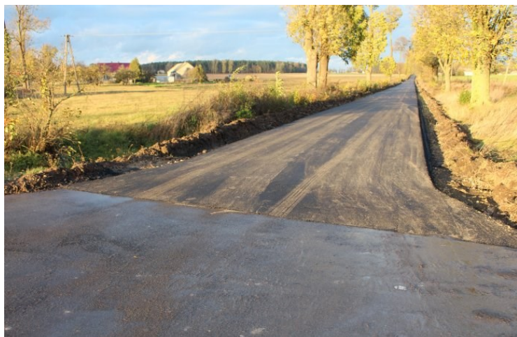
Nowa droga w Krzewie

Przedsiębiorstwo Robót Drogowo-Mostowych S.A. w Kole wykonało kolejny etap prac przy budowlach dróg w naszej gminie. Tym razem wykonano przebudowę odcinka drogi na terenie wsi Krzewo w okolicach stacji uzdatniania wody. Wcześniejsza droga, która była pokryta tłuczniem, dziś posiada nawierzchnię z betonu asfaltowego co przyczynia się do poprawy życia mieszkańców miejscowości Krzewo, Lisice oraz osób przejezdnych.