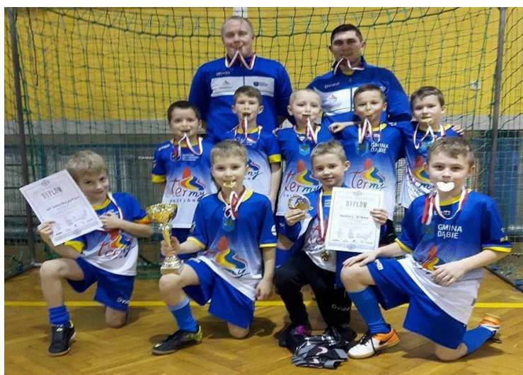
III Miejsce dla OLIMPIKO

W Dąbju takiego potencjału piłkarskiego jeszcze nie było. Po sukcesach drużyny Żaków KP "Zryw" Dąbie przyszła kolej na ich młodszych kolegów z OLIMPIKO, którzy otarli się o złoto rywalizując z drużynami z Gniezna, Konina, Zduńskiej Woli, Tuliszkowa, Turku i Skórzewa zajmując ostatecznie trzecią lokatę. Gratulujemy wyników!