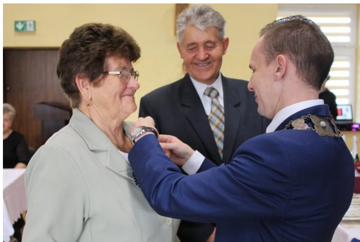
Wręczenie pamiątkowych medali podczas jubileuszu

Pod koniec października w M-GOK i BP odbyły się uroczystości z okazji jubileuszu długoletniego pożycia małżeńskiego. „Gdyby nie takie rodziny jak wasze, nie byłoby tak naprawdę nas. Powinniście być Państwo przykładem dla wielu ludzi” - tymi słowami Burmistrz rozpoczął uroczystości, podczas której wręczył 20 parom medale za Długoletnie Pożycie Małżeńskie oraz listy gratulacyjne z okazji jubileuszu Żelaznych i Diamentowych Godów.