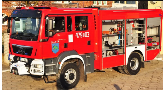
Nowe auto ratowniczo-gaśnicze OSP w Dąbiu

W połowie grudnia Ochotnicza Straż Pożarna w Dąbiu otrzymała nowy samochód ratowniczo-gaśniczy, który zastąpi wysłużonego już Jelcza. To już drugi samochód, który powiększył wyposażenie jednostki OSP w Dąbiu. Nowe auto waży prawie 18 ton i posiada zbiornik na 4500 litrów wody, ma również uterenowiony napęd 4x4 i 340 KM i jest bogato wyposażony.