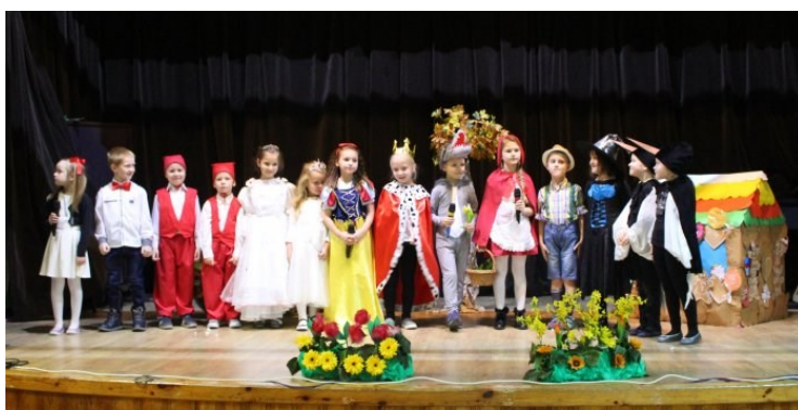
Dzieci z Przedszkola Miejskiego w Dąbiu