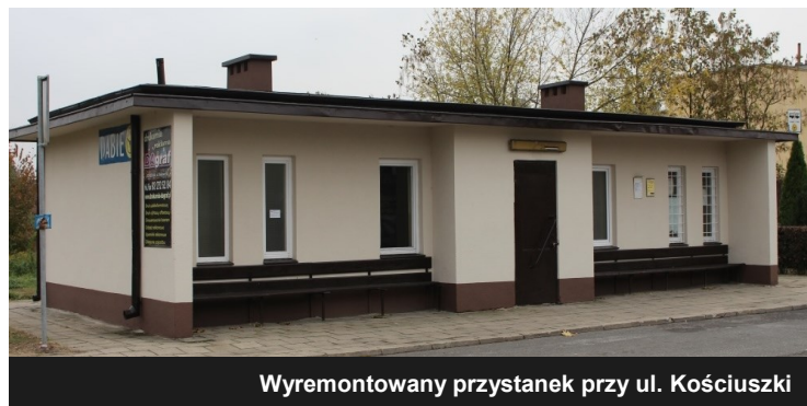
Wyremontowany przystanek przy ul. Kościuszki

Remontu doczekał się również przystanek przy ul. Kościuszki. Zaniedbane i zdewastowane pomieszczenia wewnątrz przystanku zostały gruntownie wyremontowane i pomalowane. Przystanek przyda się na pewno w mroźne oraz deszczowe dni.