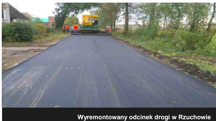
Wyremontowany odcinek drogi w Rzuchowie

Mieszkańcy Rzuchowa mogą się pochwalić wyremontowanym odcinkiem drogi. W październiku dokonano naprawy części odcinka poprzez wylanie nowej nakładki asfaltowej na wyeksploatowaną część drogi. Prace remontowe - budowlane wykonało dla nas Przedsiębiorstwo Robót Drogowo-Mostowych S.A. w Kole. Już dziś mieszkańcy Rzuchowa i przejezdni korzystają z nowej nawierzchni, która znacząco wpływa na jakość podróżowania po naszej gminie.