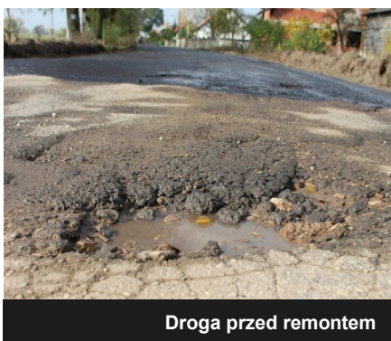
Droga przed remontem

Mieszkańcy Rzuchowa mogą się pochwalić wyremontowanym odcinkiem drogi. W październiku dokonano naprawy części odcinka poprzez wylanie nowej nakładki asfaltowej na wyeksploatowaną część drogi. Prace remontowe - budowlane wykonało dla nas Przedsiębiorstwo Robót Drogowo-Mostowych S.A. w Kole. Już dziś mieszkańcy Rzuchowa i przejezdni korzystają z nowej nawierzchni, która znacząco wpływa na jakość podróżowania po naszej gminie.