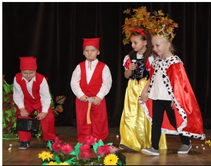
Występ dzieci z Przedszkola Miejskiego w Dąbiu