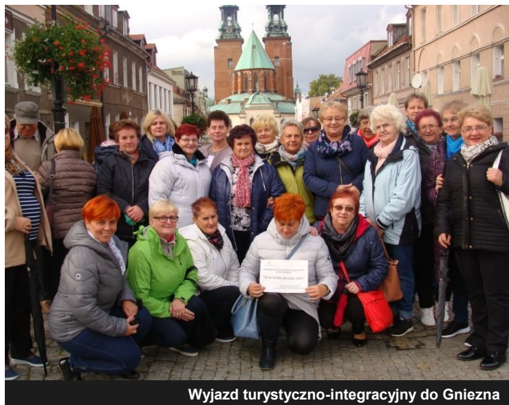
Wyjazd turystyczno-integracyjny do Gniezna

Aby wesprzeć aktywnych seniorów Wielkopolski Urząd Wojewódzki w Poznaniu – Wydział Polityki Społecznej i Zdrowia ogłosił konkurs w ramach programu „Działania na rzecz wspierania aktywności osób starszych”. Do konkursu przystąpiło Stowarzyszenie „Koło Gospodyń w Dąbiu”, aby zrealizować projekt o nazwie: „60 lat minęło jak jeden dzień”. Projekt miał na celu poprawę jakości i poziomu życia tych osób poprzez pobudzenie aktywności społecznej seniorów, dbałości o stan zdrowia, edukację, umożliwienie rozwoju nowych zainteresowań, umiejętności oraz organizację czasu wolnego i integrację wewnątrzpokoleniową. Zadanie było realizowane przez 3 miesiące, zakończyło się w październiku. W ramach projektu odbyły się spotkania ze specjalistą ds. żywienia, warsztaty rękodzielnicze i kulinarne oraz wyjazd turystyczno-integracyjny do Gniezna.