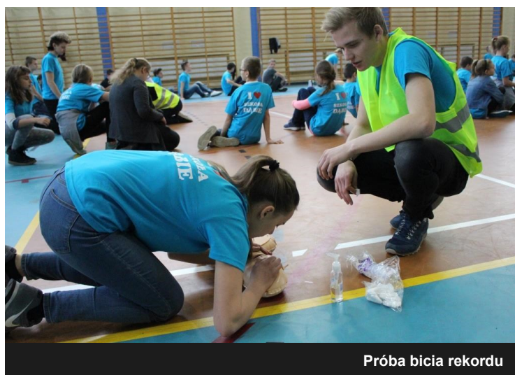
Próba bicia rekordu