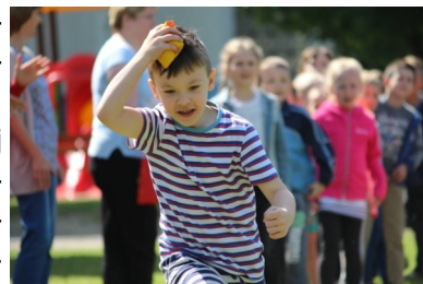
Zabawy podczas „Dnia sportu”

Jak co roku 1 czerwca z okazji Dnia Dziecka w Przedszkolu Miejskim w Dąbiu organizowana jest impreza pn. „Dzień sportu”. Przedszkolaki zaprosiły do siebie dzieci ze Szkoły Podstawowej w Dąbiu, które w ubiegłym roku opuściły progi przedszkola by rozpocząć naukę w szkole.