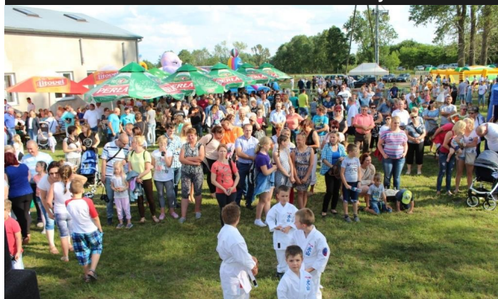
Uczestnicy obchodów „Dnia Dąbia”