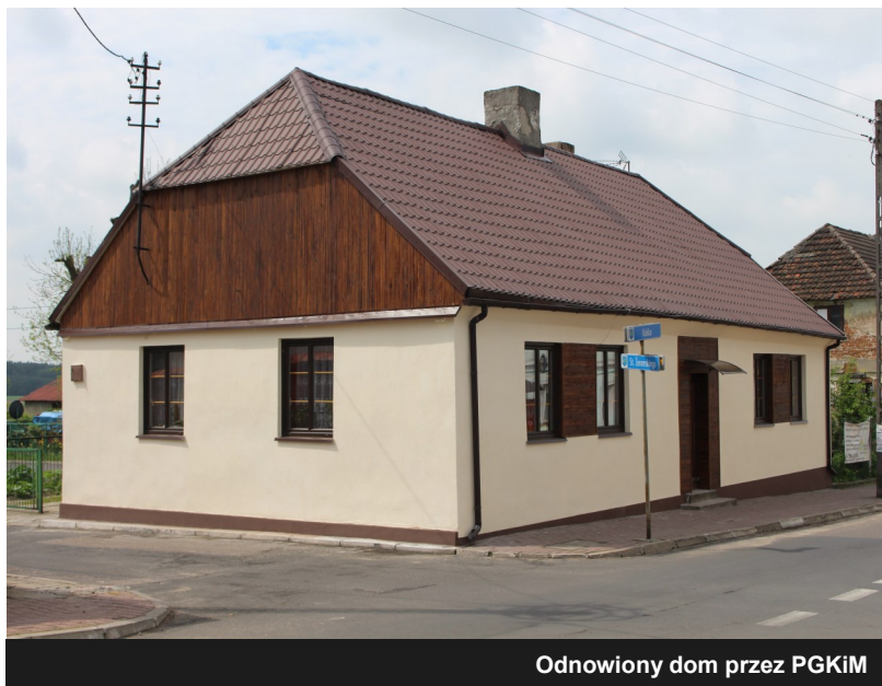
Odnowiony dom przez PGKiM

Już w najbliższym czasie planujemy podjąć kolejne kroki w celu poprawy wizerunku naszej miejscowości, o czym będziemy informować na łamach kolejnego Informatora.