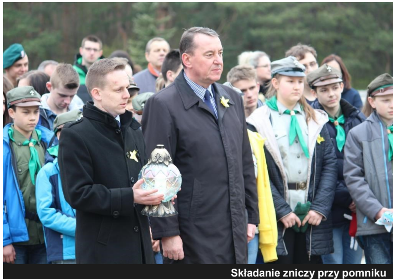
Składanie zniczy przy pomniku

W dniu 26 kwietnia w Lesie Rzuchowskim na terenie Muzeum byłego niemieckiego Obozu Zagłady Kulmhof w Chełmnie nad Nerem odbył się V Marsz Pamięci upamiętniający Ofiary Holokautu. Uroczystość jest świadectwem o 200 000 żydów zamordowanych w pierwszym niemieckim obozie zagłady, przywiezionych z gett kraju warty, a także Niemiec, Austrii, Czech, Luksemburga, oraz Romów. Marsz to również świadectwo pamięci o dzieciach z Polski i Czech, jeńcach radzieckich, nieznanym Polakach.