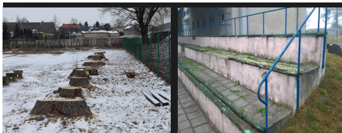
Wycinka starych drzew

W ostatnim okresie zamontowano piłkochwyty od strony rzeki Ner, wykonano konstrukcję wsporną i zamontowano nowe siedziska na trybunach oraz odmalowano barierki ochronne od strony trybun. Systematycznie wykonywane są prace pielęgnacyjne. W planach jest również wykonanie nawodnienia stadionu, naprawa ogrodzenia i wymiana pieca c.o.