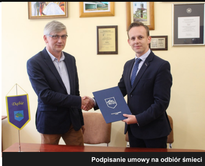
Podpisanie umowy na odbiór śmieci

W ramach wkładu własnego spółka zobowiązana była zakupić kosze na odpady. Przejęcie tak dużego przedsięwzięcia jest w naszym mniemaniu dużym sukcesem, ale także i zobowiązaniem wobec mieszkańców. W związku z powyższym będziemy dokładać wszelkich starań, aby świadczone usługi z miesiąca na miesiąc były coraz lepsze.