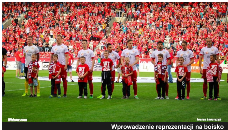
Wprowadzenie reprezentacji na boisko

3 czerwca dzieci z naszej gminy wraz dziećmi z Uniejowa trenujące piłkę nożną w Uniejowskiej Akademii Futbolu, na specjalne zaproszenie, wspólnie pojechali do Łodzi by wyprowadzić piłkarzy Widzewa Łódź i Finishparkiet Drwęca Nowe Miasto Lubawskie na mecz o mistrzostwo III ligi. Choć robili to pierwszy raz, wypadli zawodowo. Młodzi piłkarze poznali nowy stadion Widzewa "od szatni", zobaczyli, jak wygląda przygotowanie sędziów i zawodników przed wyjściem na mecz. Niepewność szybko została odstawiona na bok, kiedy piłkarze schodzili do szatni po rozgrzewce. Przybijali piątki z chłopcami i kierowali do nich miłe słowa. Na twarzach dzieciaków widać było wzruszenie i dumę, a wyjście na murawę stadionu, na którym zasiadło 14 tys kibiców, z sędzią czy piłkarzem, było spełnieniem marzeń niejednego młodego sportowca. Piłkarze obu drużyn z życzliwością i sympatią rozmawiali z młodymi piłkarzami, odpowiadali na pytania, które do nich były kierowane.