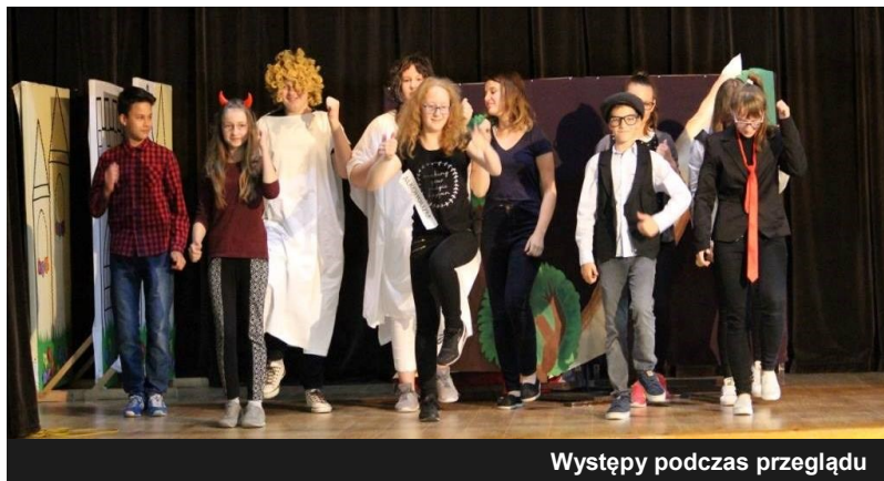
Występy podczas przeglądu