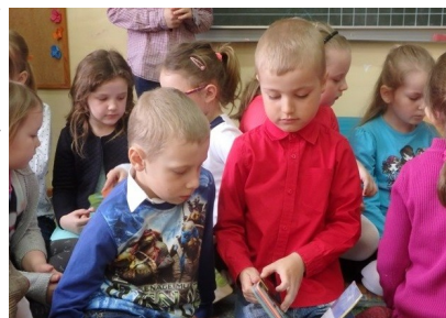
Spotkanie z przedszkolakami podczas „Tygodnia bibliotek”

Od 8 do 15 maja w naszej Gminie odbywał się „Tydzień Bibliotek” rozpoczęły kolejnym spotkaniem "O książce przy herbacie" Dyskusyjnego Klubu Książki. Miło nam poinformować, że grono uczestników Klubu staje się coraz większe i z tego miejsca chcemy zaprosić wszystkie chętne osoby do uczestnictwa w kolejnych spotkaniach.