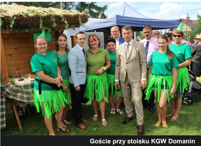
Goście przy stoisku KGW Domanin

Dzień Ogórka stworzył możliwość wypromowania ogórka jako produktu lokalnego, poznanie jego wartości odżywczych, warunków i sposobu uprawy, ochrony przed szkodnikami oraz poznanie różnych jego odmian i ich przydatności do przetwórstwa. Dzięki wcześniej przekazanym nasionom ogórka rolnikom przez Przedsiębiorstwo Nasiennictwa Ogrodniczego i Szkółkarstwa z Ożarowa