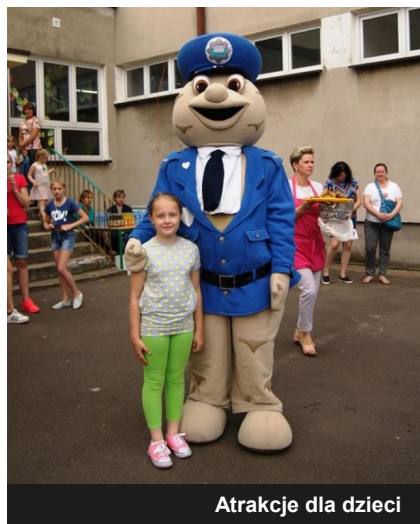
Atrakcje dla dzieci

Szkoła Podstawowa w Chełmnie, wspólnie z Radą Rodziców w bieżącym roku szkolnym jest organizatorem dwóch takich wyjazdów dla dzieci: 21 kwietnia 2017 r. dla dzieci z klas I – VI Szlakiem Piastowskim oraz 6 czerwca 2017 r. dla dzieci z oddziałów przedszkolnych do zoo w Borysewie. Koszt tych wyjazdów to ok. 14 500,00 zł.