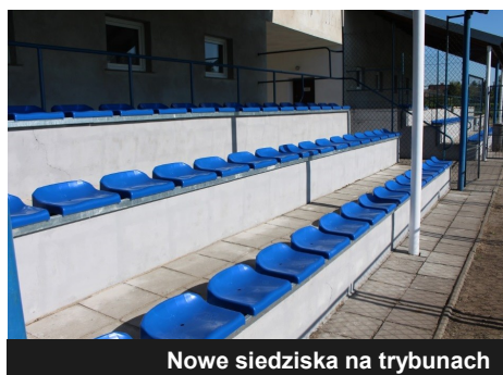
Nowe siedziska na trybunach

uzupełniono ubytki w murawie. Ponadto odmalowano pomieszczenia sanitarne i odnowiono szatnię. W okresie