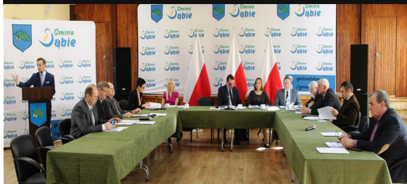
Posiedzenie Rady Miejskiej w Dąbiu

Podczas comiesięcznych sesji Rady Miejskiej podejmowane są kolejne uchwały, które bezpośrednio wpływają na różne dziedziny funkcjonowania naszej gminy.