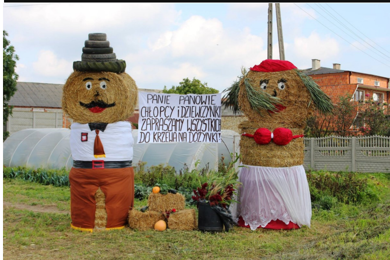
Dekoracje okolicznych domów wsi Krzewo

Całość tradycyjnie prowadzona była przez Młodzieżowo-Strażacką Orkiestrę Dętą z Dąbia.