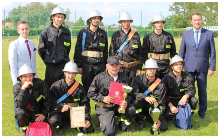
Drużyna OSP Rośle

W zmaganiach sportowo-pożarniczych wzięło udział 9 drużyn, które uczestniczyły w 2 konkurencjach: sztafeta pożarnicza 7x50m z przeszkodami oraz ćwiczenia bojowe. Ostatecznie 1 miejsce zajęła drużyna OSP Rośle. W zawodach wzięły również udział młodzieżowe drużyny pożarnicze z Dąbia, Karszewa i Domanina. Po zakończonych zawodach wszyscy zawodnicy otrzymali pamiątkowe dyplomy i nagrody ufundowane przez sponsorów.