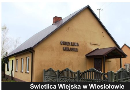
Świetlica Wiejska w Wiesiołowie

Prace przy remoncie Świetlicy Wiejskiej w Wiesiołowie dobiegł końca. Projekt zrealizowany został dzięki wsparciu Urzędu Miejskiego oraz środkom z funduszu sołectwa wsi Wiesiołów. Prace wykonane zostały w dwóch etapach, pierwsza część dotyczyła elewacji zewnętrznej natomiast druga kompleksowego remontu pomieszczeń wewnątrz świetlicy. Podziękowania należą się mieszkańcom, którzy w ramach wkładu własnego wykonali większość prac remontowych we własnym zakresie.