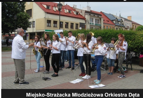
Miejsko-Strażacka Młodzieżowa Orkiestra Dęta