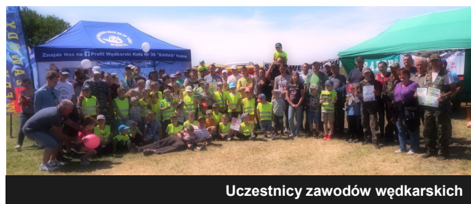
Uczestnicy zawodów wędkarskich

W dniu 3 czerwca, z okazji Dnia Dziecka, na rzece Ner w miejscowości Rzuchów odbyła się już 4 impreza sptawikowa zorganizowana przez Zarząd Koła nr 36 „Karaś” Dąbie, przy współpracy ze sklepem wędkarskim „Wojciech Odrowski”. Na spotkanie zostały zaproszone dzieci wraz opiekunami z całej Gminy oraz zaprzyjaźnieni sympatycy koła wędkarskiego.