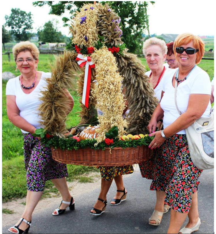
Wieniec Koła Gospodyń w Dąbiu przygotowany na Dożynki w Krzewie