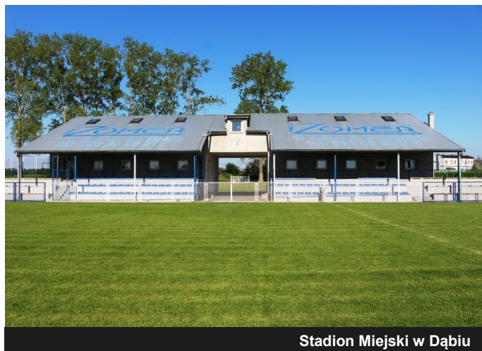
Stadion Miejski w Dąbii

Gruntowną modernizację przeszedł Stadion Miejski w Dąbii, który jeszcze nie tak dawno był całkowicie wyłączony z użytkowania. W minionym roku podjęto szereg prac mających na celu przywrócenie płyty boiska zdegradowanej i zniszczonej przez krety i brak systematycznych prac pielęgnacyjnych. Dowieziono ziemię w celu wyrównania płyty boiska, a dzięki wsparciu firmy Agronas