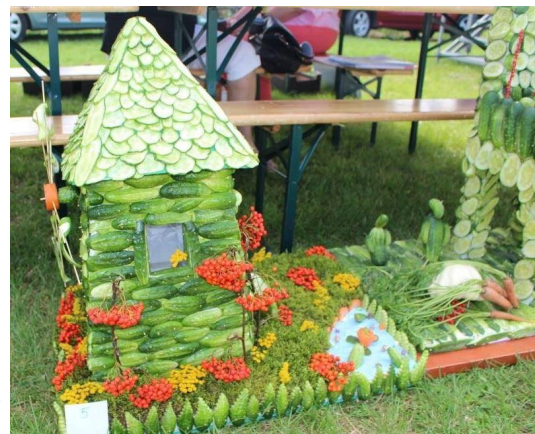
Prace konkursowe wykonane z ogórków