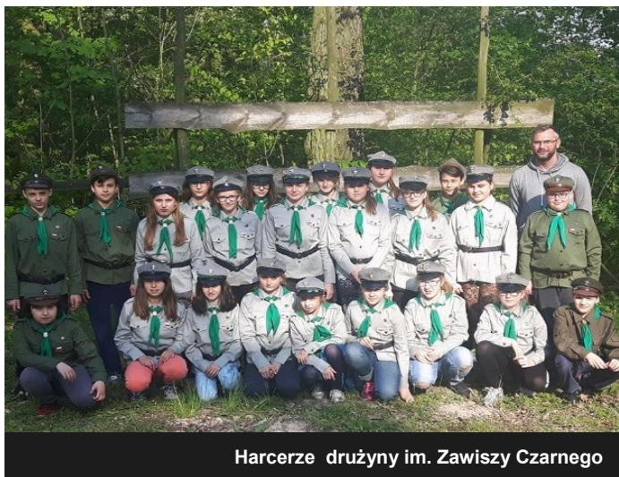
Harcerze drużyny im. Zawiszy Czarnego

W maju harcerze drużyny im. Zawiszy Czarnego z Zespołu Szkół w Dąbiu, korzystając z pięknej majowej pogody, wybrali się na wycieczkę rowerową do lasu na ścieżkę przyrodniczo-leśną „Grabina”. Na miejscu harcerze brali udział w różnego rodzaju grach sportowych, a na zakończenie zrobili ognisko z pieczonymi kiełbaskami.