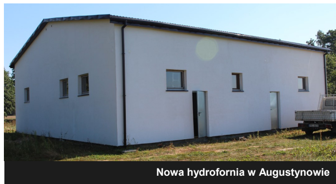
Nowa hydrofornia w Augustynowie

Prace przy budowie nowej hydrofornii w Augustynowie rozpoczęły się pod koniec sierpnia ubiegłego roku, a już dziś możemy cieszyć się nową jakością wody, która popłynęła z kranów pod koniec września.