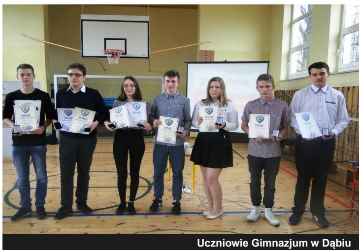
Uczniowie Gimnazjum w Dąbiu

27 kwietnia 2017 roku w Zespole Szkół w Dąbiu odczytany został Katyński Apel Pamięci, aby w 77 rocznicę Zbrodni Katyńskiej przywołać pamięć naszych rodaków zamordowanych za wierność przysiędze wojskowej złożonej na sztandar z hasłem "Bóg, Honor, Ojczyzna"