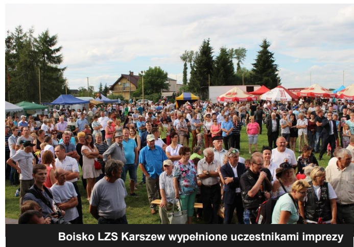
Boisko LZS Karszew wypełnione uczestnikami imprezy

Na Dniu Ogórka swoje miejsce znalazły stoiska promujące produkty rolnictwa ekologicznego oraz zdrowego stylu życia. Pojawilo się stoisko gdzie można było odbywać indywidualne konsultacje z dyplomowanym diabetologiem, a także przed sceną wykonać ćwiczenia ruchowe z instruktorem aerobiku i zumbi. Pracownicy Urzędu Miejskiego Wydziału Infrastruktury, Ochrony Środowiska i Kultury udzielali mieszkańcom gminy informacji dotyczących zarządzania projektami z zakresu rozwoju obszarów wiejskich, planowania rozwoju lokalnego oraz rozwoju cyfrowego społeczeństwa. Na stoiskach lokalnych twórców ludowych można było podziwiać rzeźby oraz misternie robione serwety i obrusy. Nie zabrakło tradycyjnie na tę okazję gotowanej zupy ogórkowej