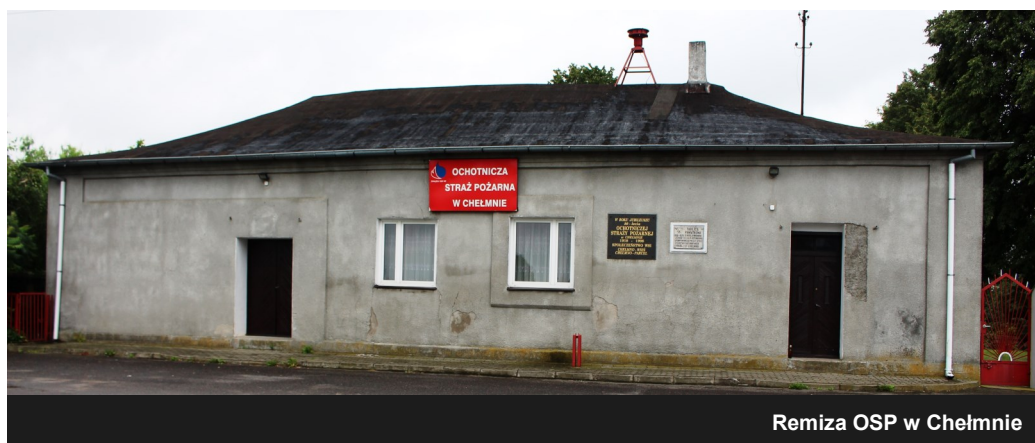
Remiza OSP w Chełmnie

Miło nam poinformować, że dzięki przystąpieniu do programu Wielkopolskiej Odnowy Wsi (WOW) rozpoczęły się prace remontowe i modernizacyjne Świetlicy Wiejskiej w budynku OSP w Chełmnie. W ubiegłym roku na podobnych zasadach wyremontowano świetlicę we wsi Lisice. Całość uzyskanego dofinansowania z WOW to kwota 30.000,00 zł przy wkładzie własnym gminy ok. 30.000,00 zł i środkom wygospodarowanym z funduszu sołeckiego oraz pracy własnej mieszkańców. Nie ulega wątpliwości, że realizacja projektu podniesie jakość życia mieszkańców Chełmna, będzie sprzyjać odbudowaniu tożsamości lokalnej oraz zintegruje mieszkańców w trakcie realizacji poszczególnych zadań projektowych. Projekt mieści się w zakresie zagospodarowania przestrzeni publicznej, poprawiając jednocześnie estetykę miejscowości, ale również funkcjonalność jednego z najważniejszych obiektów w Chełmnie – świetlicy wiejskiej, która już w przyszłym roku będzie obchodziła okrągłą rocznicę 100-lecia istnienia.