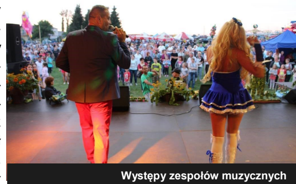
Występy zespołów muzycznych