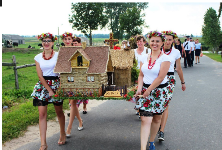
Korowód z wieńcami podczas Dożynek

Uroczystości rozpoczęły się przejazdem maszyn rolniczych i samochodów strażackich, które podążały za bryczką konną przewożącą Księżę wraz z Burmistrzem Miasta. Wszystkie pojazdy zostały symbolicznie obsypane zbożem i kwiatami. Wśród przejeżdżających maszyn można było zauważyć scenkę rodzajową jak prowadzono kiedyś żniwa za pomocą cepów. Następnie korowodem za wozami podążały delegacje strażackie ze sztandarami, Koła Gospodyń Wiejskich wraz z wieńcami oraz zaproszeni goście.