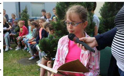
Wspólne czytanie ulubionych książek

Głównym celem akcji jest promocja czytania książek wśród uczniów, inicjowanie mody na czytanie oraz wspieranie dzieci i młodzieży aktywnych czytelniczo.