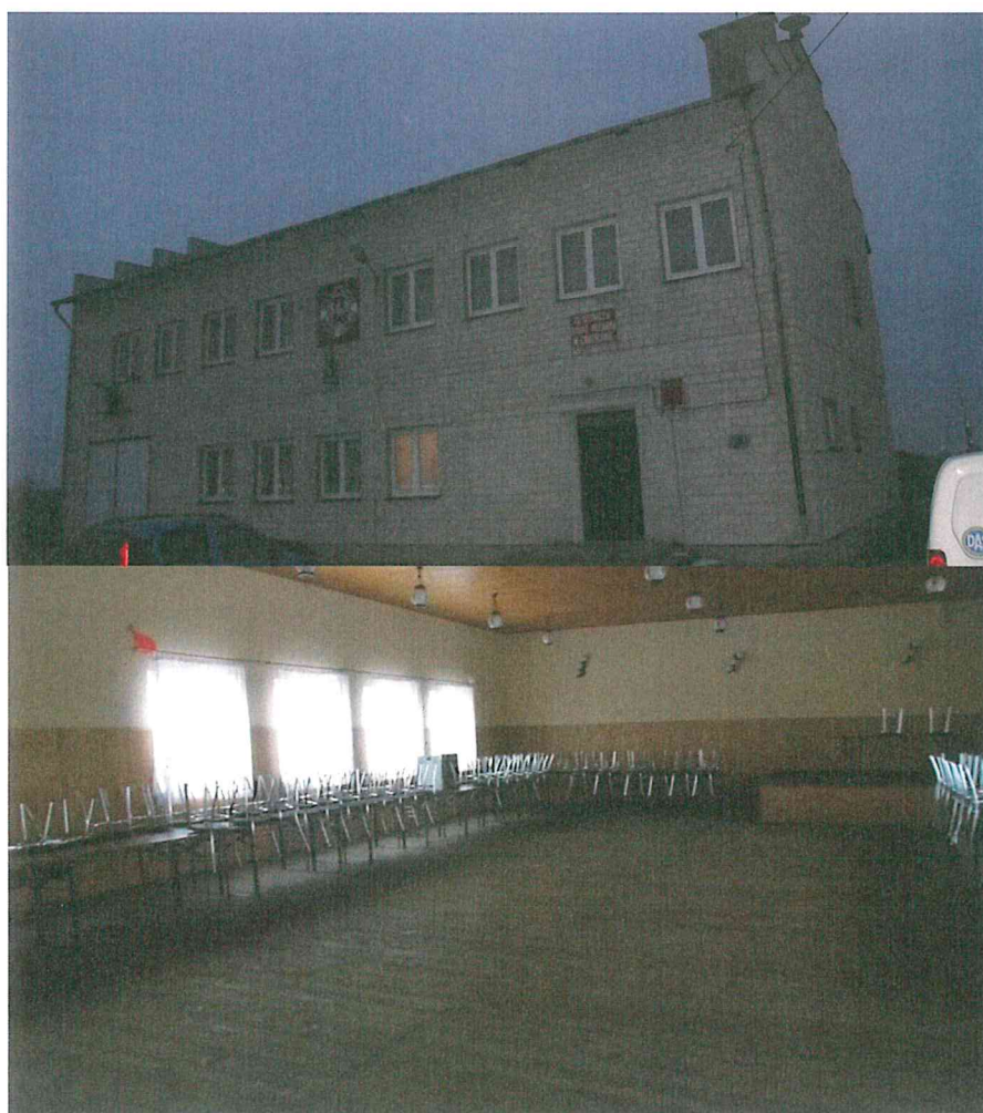
Zdjęcie 2. Świetlica wiejska

Nie ulega jednak wątpliwości, że najważniejszym społecznie obiektem we wsi Chruścin jest świetlica wiejska (Zdjęcie 2). Jest to miejsce spotkań, integracji i zabawy mieszkańców wsi. Wymaga ono jednak doposażenia oraz modernizacji. To pilna potrzeba mieszkańców miejscowości