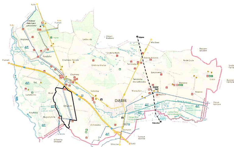
Rysunek 2. Położenie wsi Chruścin w Gminie Dąbie

Chruścin to wieś położona w województwie wielkopolskim, w powiecie kolskim, w gminie Dąbie. W latach 1975-1998 miejscowość administracyjnie należała do województwa konińskiego. Miejscowość położona jest na granicy z województwem łódzkim. Wieś znajduje się niedaleko autostrady A2. Miejscowość położona jest na granicy z województwem łódzkim (rysunek 2). W podziale regionalnym autorstwa Jerzego Kondrackiego z 1976 r, grunty znajdują się na obszarze Nizin Środkowopolskich, we wschodniej części makroregionu Niziny Południowowielkopolskiej i w południowej części mezoregionu Wysoczyzny Kłódawskiej. Część gruntów położona jest na obszarze Natura 2000.