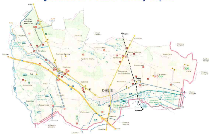
Rysunek 2. Podział Gminy Dąbie