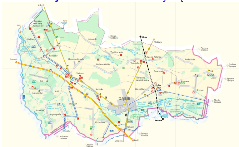
Rysunek 2. Podział Gminy Dąbie

Źródło: http://pl.wikipedia.org/wiki/Blizan%C3%B3w_(gmina) i www.osp.org.pl