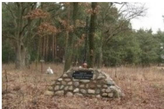
Zdjęcie nr 1 Cmentarz Ewangelicki