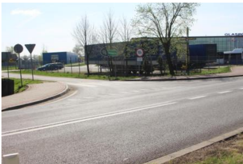
Zdjęcie 7 Zakład produkcyjny