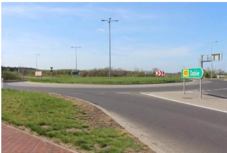
Zdjęcie nr 6 Zjazd z autostrady A2

Wieś jest głównie rolnicza. Część mieszkańców utrzymuje się z hodowli zwierząt w tym tuczniaka, krów, a także produkcji rolnej, w tym zboża, kukurydzy, buraków cukrowych, ogórków. Niektórzy z mieszkańców zatrudnieni są w przemyśle i usługach w okolicznych miejscowościach. Wiele osób znalazło zatrudnienie w zakładzie przetwórstwa szkła i materiałów szklanych w firmie Glaspo sp. z.o.o. znajdującej się przy zjeździe z Autostrady A2 w Domaninie.