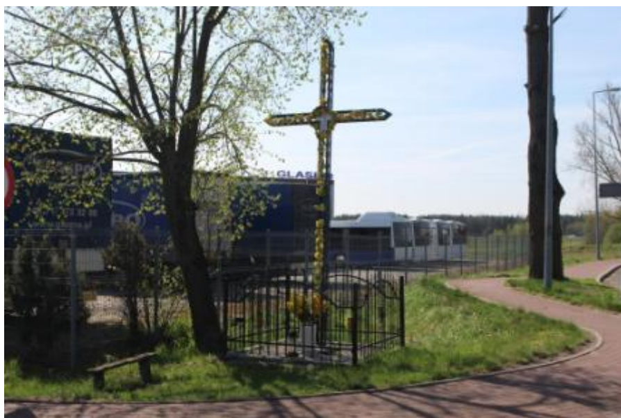
Zdjęcie nr 3 Przydrożny krzyż