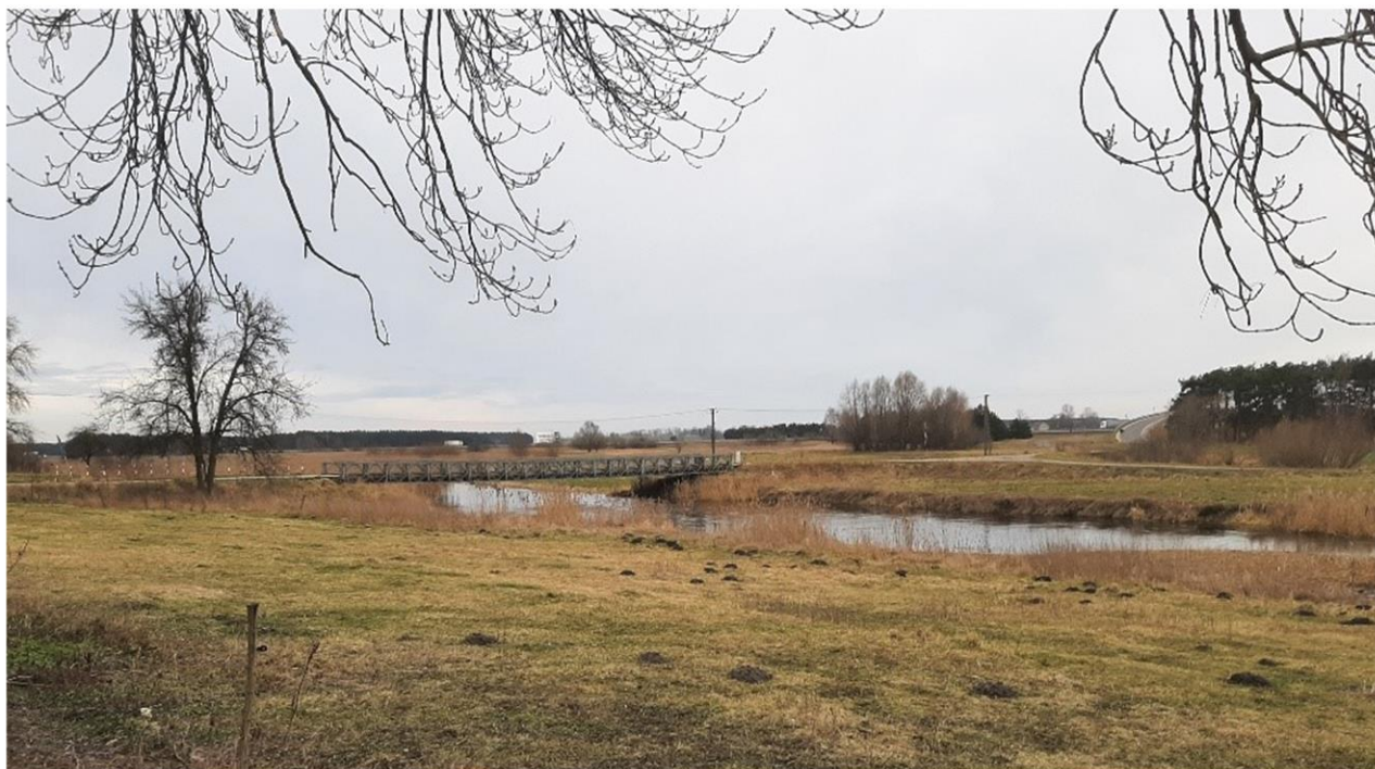
Oryginalny most Bailey'a