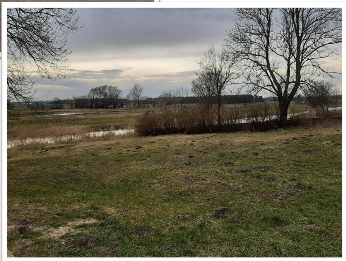
Teren przy świetlicy