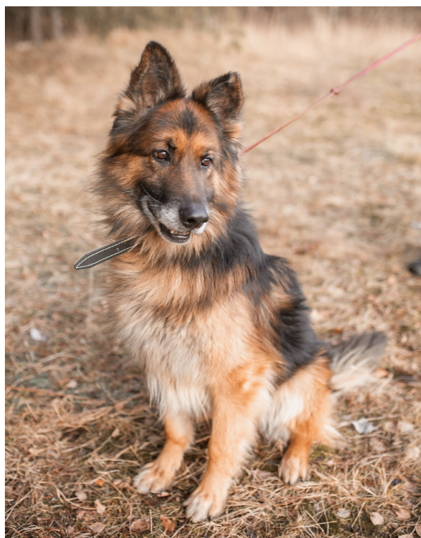
PŁEĆ: SAMIEC LASSIE 616019310002278

https://funny-pets.pl/nasze-ogonki?query=Podopieczny%20Miasto%2FGmina_D%C4%85bie