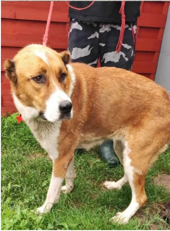
PŁEĆ: SAMICA GRAŻKA 616093902341127

Grażka to wycofana sunia, aż boimy się pomyśleć co musiało ją spotkać, zanim do nas trafiła. Zabezpieczyliśmy ją bardzo wychudzoną, złąknioną, więc teraz pracujemy nad tym, by wyprowadzić ją z tego stanu. Dokarmiamy, stosujemy specjalną dietę i nawiązujemy codzienny kontakt, by zdobyć jej zaufanie. Grażka potrzebuje jeszcze trochę czasu, by pozwolić się nam i Wam lepiej poznać.