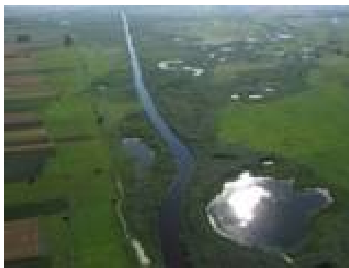
Zdjęcie 1. Dąbskie Błota

Wieś znajduje się w dorzeczu rzeczki Ner, gdzie znajdują się tereny torfowo-bagiennie. Elementem wartościowym przyrodniczo są Dąbskie Błota, czyli kompleks łąkowo-depresyjny o powierzchni ok. 700 ha, który mocą uchwały Rady Miejskiej w Dąbiu został uznany za użytek ekologiczny. Swym zasięgiem obejmuje on miasto Dąbie oraz wsie: Krzewo, Karszew, Wiesiołów, Kupinin i Domanin. Teren ten został włączony do sieci Natura 2000 jako część obszaru specjalnej ochrony ptaków – Pradolina Warszawsko-Berlińska oraz obszar specjalnej ochrony siedlisk – Pradolina Bzury i Neru (Zdjęcie 1).